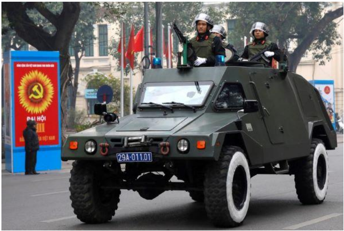
Lực lượng công an bảo vệ Đại hội đảng 13 năm 2021.