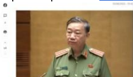
screenshot of Bao Dien Tu Chinh Phu (Public domain)

Bộ trưởng Công an Tô Lâm tại Ủy ban Thường vụ Quốc hội, 10/8/2022.