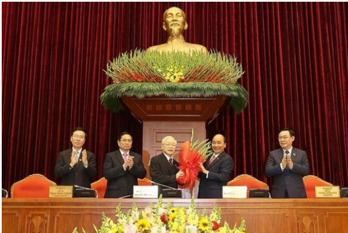
Các lãnh đạo của Đảng Cộng sản Việt Nam tại Đại hội 13 ở Hà Nội hôm 31/1/2021.