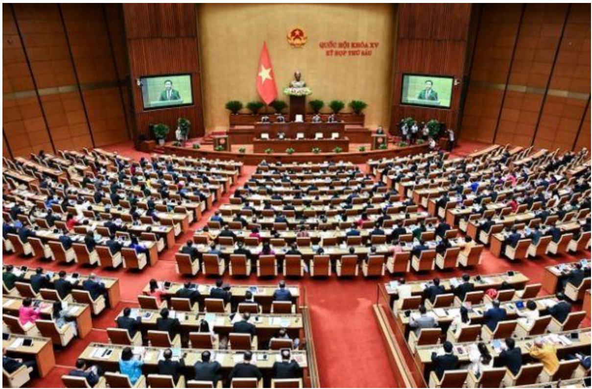
Quốc hội họp ở Hà Nội hôm 23/10/2023 (minh họa).