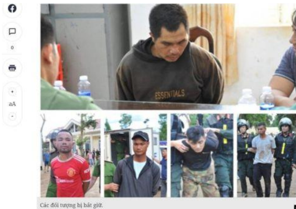
Các đối tượng bị bắt giữ.