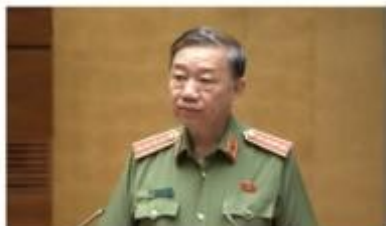
screenshot of Bao Dien Tu Chinh Phu