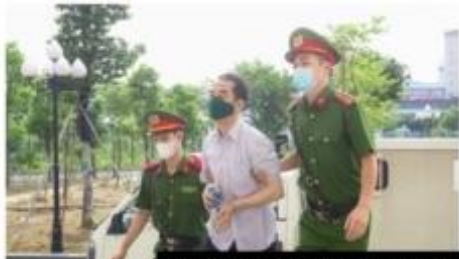
Người Lao Động (Web Screenshot)

Giữa khẩu hiệu và hành động, giữa các quy định về chính sách của ĐCSVN và những thực tế khi người dân và doanh nghiệp phải “đến cửa quan” cách xa nhau một trời một vực.